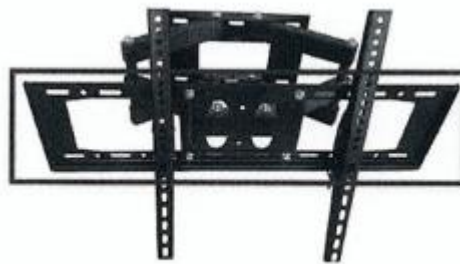
ภาพประกอบแผงรับทีวีขนาด ๕๕ นิ้ว